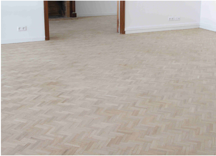
Parket net blankgeschuurd