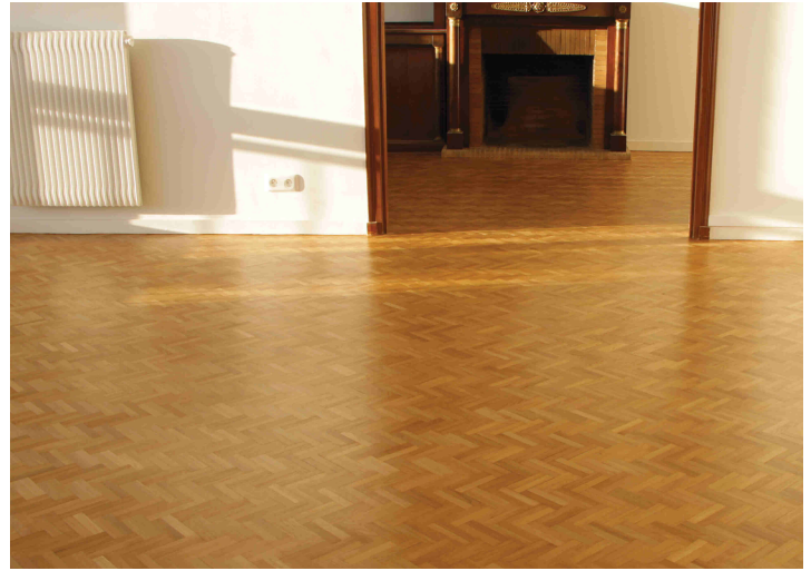
Parketvloer na het aanbrengen van 3 lagen Performer®